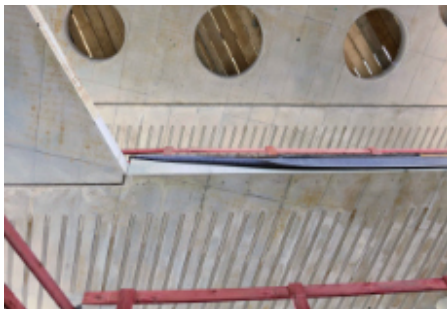
Stahlbetondecke mit Akustikelementen

Bereits die Römer verwendeten das opus caementitium, woraus sich unser Wort Zement herleitet. Beton besteht aus Kies, Sand und Zement als Bindemittel. Durch die Zugabe von Wasser wird der chemische Abbindevorgang eingeleitet. Zur Steuerung der Eigenschaften des Betons können bestimmte Zusatzstoffe und -mittel beigemischt werden. Beton lässt sich in nahezu beliebige Formen gießen, ermöglicht ein breites Gestaltungsspektrum und kann beinahe überall verbaut werden. Bedauerlicherweise gilt die notwendige Zementproduktion mit ihrem hohen CO 2 -Ausstoß als einer der Hauptverursacher der Klimaveränderungen.