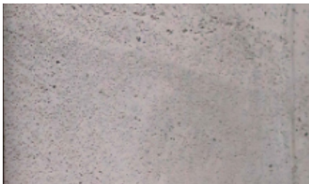
Wand aus Infralichtbeton

Durch die einschalige Konstruktion entfallen Arbeitsschritte für zusätzliche Dämmschichten, Anschlüsse werden einfacher, Bauteile werden robuster und recyclingfähig. Allerdings muss die Hydratationswärme, die wegen der guten Dämmeigenschaften schlecht abfließen kann, durch geeignete Maßnahmen reduziert werden. Die geringe Frischbetonrohddichte des Infralichtbetons (die Zuschläge sind leichter als das Wasser) erfordert ein durchdachtes Verdichtungskonzept. Außenbauteile aus wärmedämmendem Leichtbeton sind aufgrund ihrer geringen Dichte und porigen Struktur empfindlich gegen eindringende Feuchtigkeit. Die großen Schwind- und Kriechverformungen und der geringe Elastizitätsmodul müssen planerisch berücksichtigt werden.