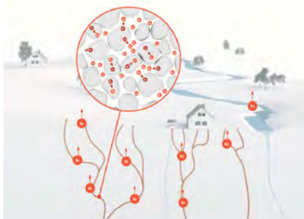
Radonaktivitätskonzentration in der Bodenluft

Ende 2018 wurde in Deutschland das neue Strahlenschutzgesetz (StrlSchG) verabschiedet. Darin wird die Messung der Radonkonzentration in den Radonvorsorgegebieten für alle Räume im Keller- oder Erdgeschoss angeordnet, in denen sich Arbeitsplätze befinden. Demnach gilt für die Radonkonzentration in der Luft dieser Räume ein Referenzwert von 300 Bq/m 3 im Jahresdurchschnitt.